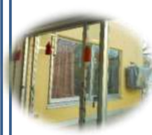
かん き 換気

※使用 しよう できる遊具 ゆうぐ ・活動 かつどう に制限 せいげん があります。 ※行事 ぎょうじ は密集 みっしゅう ・密接 みっせつ しないもの もの を実施 じっし します。 ※距離 きょり をとって過 す ごすように声 こゑ かけをしています。