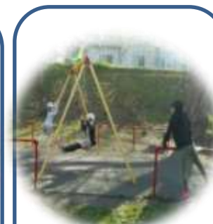
そとあそび 外遊び