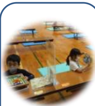
みつ さ 3密を避ける