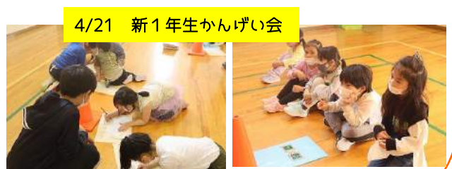
4/21 新1年生かんげい会