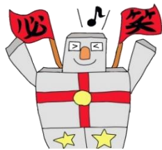
マスクットキャラクター 『 みつろう 必笑ロボくん』