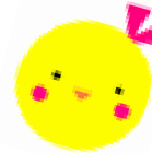
丘珠ひばり児童会館 マスコットキャラ “ひば子”