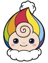
しゅうかいしつ 集会室