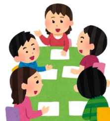
レインボーファームぶ メンバー申込書