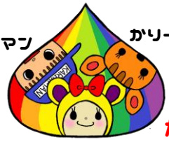
かりたまキャラクター