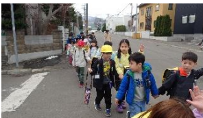
しゅうだんげこう 集団下校