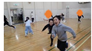
おにごっこ であそぼ